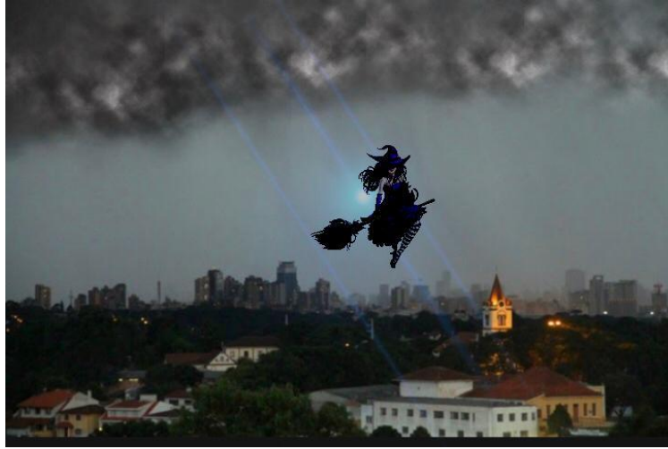
Ilustración por Helena Klapp La bruja volando sobre la ciudad.

Entonces, cada vez que un cazador entrara al bosque para deforestar la naturaleza o matar a sus animales, los ponía en un sueño profundo, esa era la única forma de mantener el bosque a salvo.