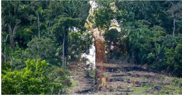
Ilustración por Maria Barretto

La floresta moriría si los hombres continuasen con las cazas y extracciones. Una ira subió por todo su cuerpo, no tenía tiempo que perder, corrió de vuelta a la ciudad movida por su ira.